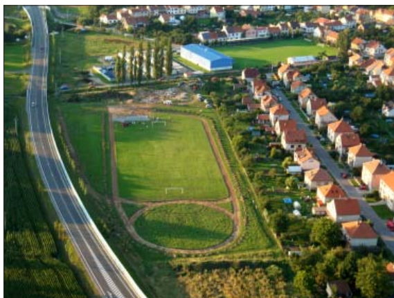
4. místo