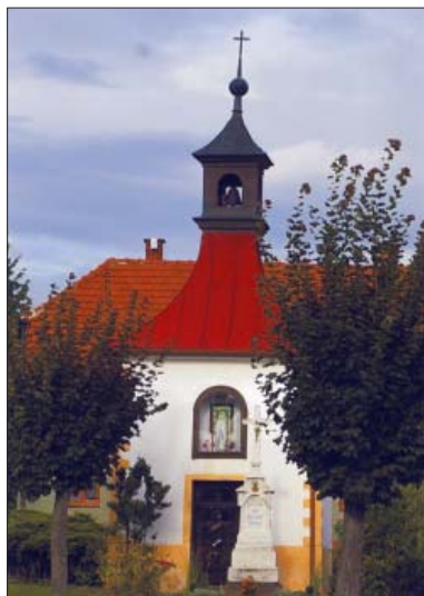
3. místo