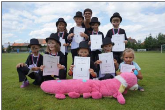
1. místo