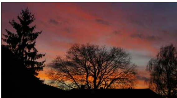
2. místo